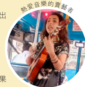
熱愛音樂的賣藝者

厄瓜多爾 (Ecuador) 位於南美洲。我們在厄瓜多爾的最大城市瓜亞基爾事奉六年，處身異文化中，生活難免面對「文化衝擊」，就像武俠小說中遇上不同的絕世招式，需要「見招拆招」，才能掌握生存之道。「拆招」要以尊重、欣賞當地文化為前題，惟面對這裏文化所藏的招式，我們實在感到功力不足，有時還會因這些招式帶來困擾，需要更多時間，讓自己提昇至更高境界，才能誇勝。謹在此分享當中的三個難解招式。