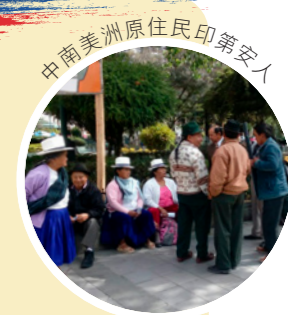
中南美洲原住民印第安人