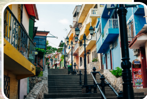
厄瓜多爾七彩繽紛的房子