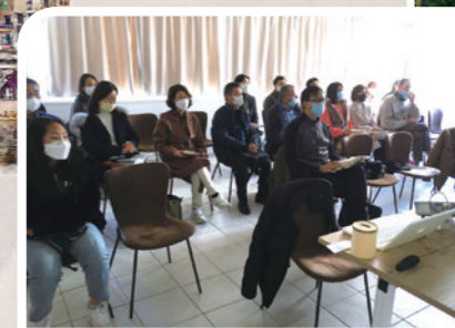
國際教會中的亞洲家庭到現在仍會戴口罩， 西方信徒則不會。