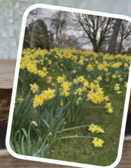
春天的小花迎接作者夫婦的訪英旅程