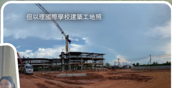
但以理國際學校建築工地照