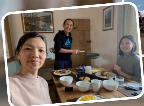
作者(左)夫婦與女兒在英國農莊小舍團聚