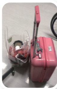
出院時學生們帶來水果和禮物，令作者深深感受到大家的愛。