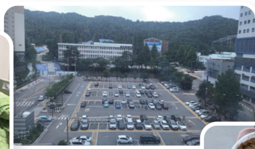
手術前作者在病房內倚窗外望，想到經歷過生命的脆弱與有限，愈感受到上帝不離不棄的愛。