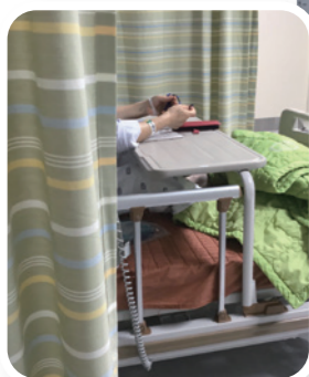
作者接受手術前靈修禱告，仰望上主。