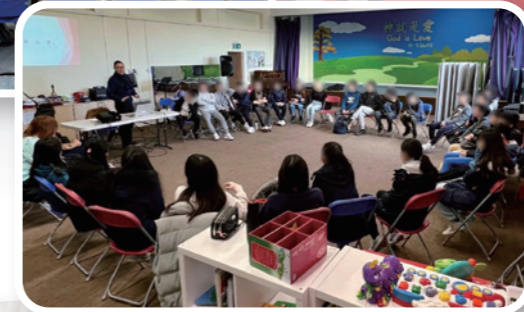
華人教會的青少年團契