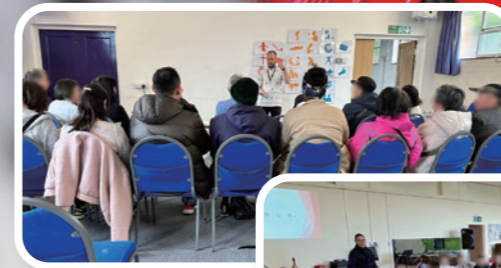
倫敦英語教會為華人新移民開設的英文班