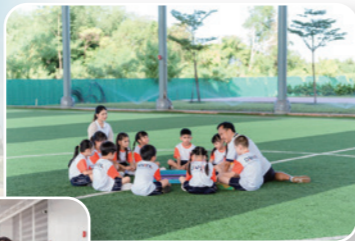
圖為泰南工場 「即商亦宣」模式辦學及開店

現代 (特別是疫情後) 的帶職宣教，包括營商宣教，是跨文化宣教四個主要大趨勢之一 1 。面對各種跨國界的新動態如中國崛起、各處戰禍、恐怖活動、環境破壞等衝擊下，我們發現全球跨文化宣教的